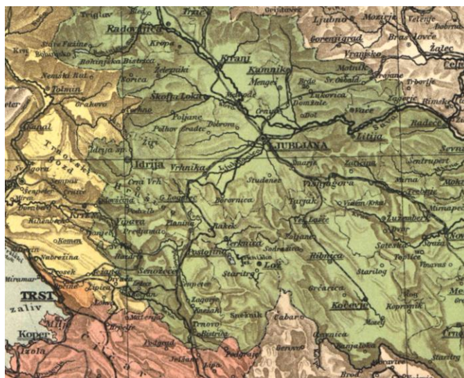
Karta 1: Izsek iz zemljevida Kranjske in Primorske, (Trst, Gorica-Gradišče in Istra), Povzeto po: V. pl. Haardtov Zemljepisni atlas, 1899, str. 3.

začutili, da ne pripadajo več samo kraljestvom, pokrajinam ali drugim ozemeljskim celotam, pač pa tudi narodom, ki jih povezujejo skupni izvor, jezik, običaji in skupna zgodovina. Čeprav meščanstvo leta 1848 politično še ni zmagalo, so tedanje revolucije najpomembnejša prelomnica 19. stoletja. Fevdalizem je bil povsod (razen v Turčiji in Rusiji) odpravljen, meščanstvo pa je začelo svoj zmagoviti vzpon. Temeljito se je spreminjala tudi zunanja podoba Evrope, v kateri so vse višji dimniki in velike, hrupne tovarne zamenjali skozi stoletja skoraj nespremenjene majhne obrtne delavnice. Začeli so se novi časi, katerih poglobljena značilnost je bil vse hitrejši življenjski utrip (S. Berzelak, 250-253)