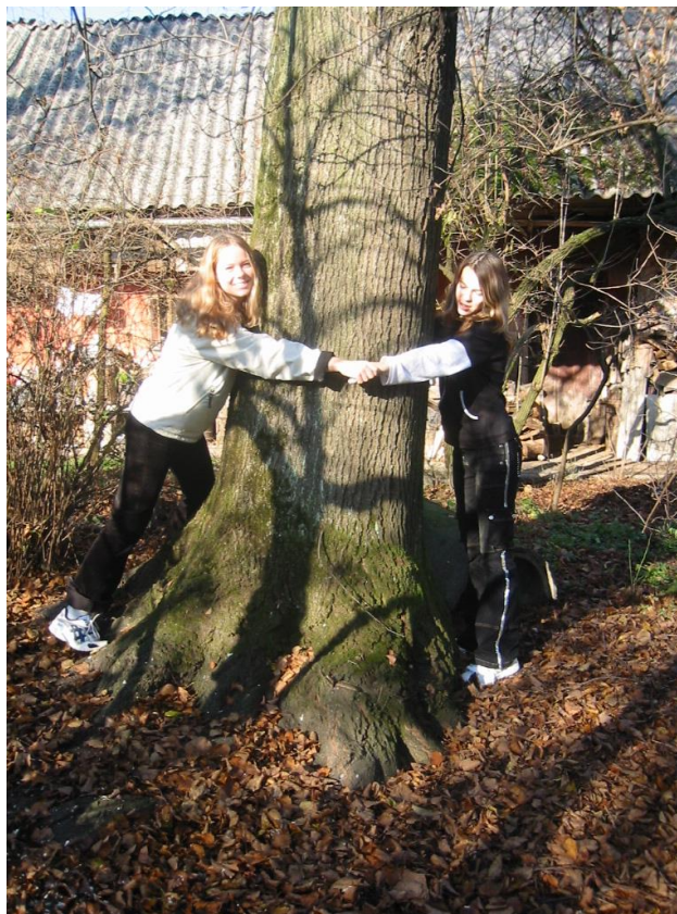
Slika 10: Ob stari hruški pred Kofutnikovo domačijo