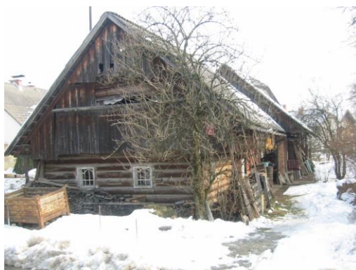
Slika 1: Stanovanjski del Kofutnikove hiše.

Naša šola je predlagala Zavodu RS za varstvo kulturne dediščine Kranj, da domačijo zaščiti kot kulturni spomenik lokalnega pomena. Trenutno teče postopek za vpis v register kulturne dediščine Slovenije.