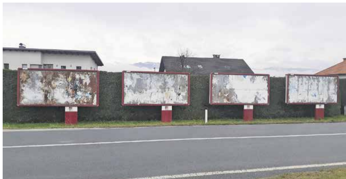
Veduta na izvozu pri beninski črpalki v Stobu: oglaševalec Amicus vas pozdravlja!