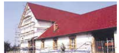
Nekdanje zbirno taborišče pomagajo s prispevki obnavljati tudi naši člani in članice.