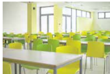
Nova jedilnica na OŠ Domžale že čaka na naše šolarje.

Potekajo tudi asfaltiranja po obnovi vodovodov in kanalizacij. Na Stritarjevi cesti v Dobu podjetje JKP Prodnik, d. o. o., izvaja obnovo vodo-