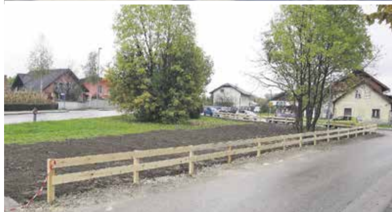
Preserje pri Radomljah pred in po odvozu nelegalno odloženih odpadkov