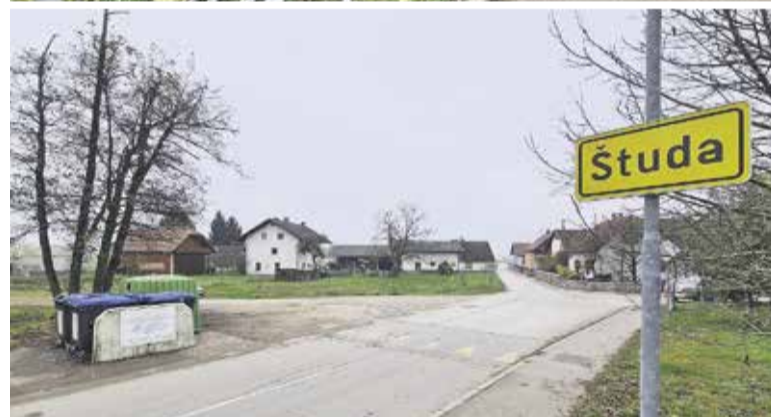
Študa pred in po odvozu nelegalno odloženih odpadkov