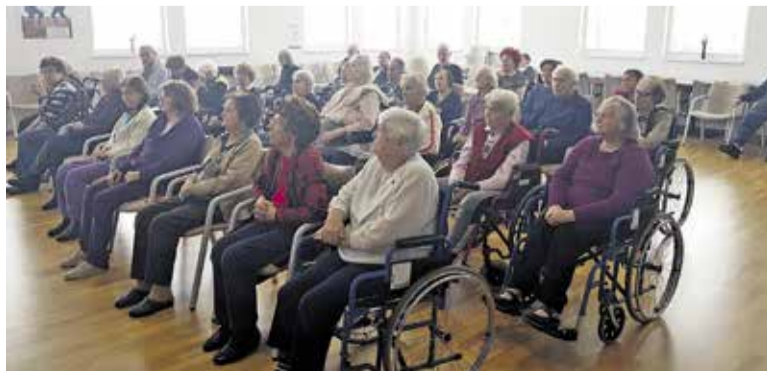
Starostniki na delavnici varne starosti

Obstajajo številne druge nevladne organizacije, kot sta Humanitarček in Simbioza, ter pobude posameznikov, ki ponujajo možnosti za sproščen klepet in zaupanje. Eden takšnih je Čvekifon, brezplačni klepetalnik za starejše na telefonski številki 080 38 07. Telekom Slovenije je vsem domovom za starejše omogočil brezplačen najem določenega števila mobilnih telefonov in neomejen mobilni prenos podatkov, da lahko starostniki s svojci klepetajo tudi preko videoklica. Takšne pobude in geste številnih posameznikov in organizacij dokazujejo, da se ljudje znajo povezati in si pomagati v težkih obdobjih. Zato si ne zatiskajmo oči in ušesa pred izkušnjo nasilja, spregovorimo in podelimo kamenček svoje bolečine z drugimi. □