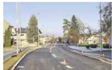
Ljubljanska cesta v Domžalah je odprta.

nika deluje ožje, vendar je v skladu s cestnimi določili dovolj široko za ustrezno srečevanju tudi dveh tovornih vozil ali avtobusov, na pločniku pa dovolj prostora za pešce kot tudi kolesarje. Za še večjo varnost so dodane tudi ustrezne talne označbe.