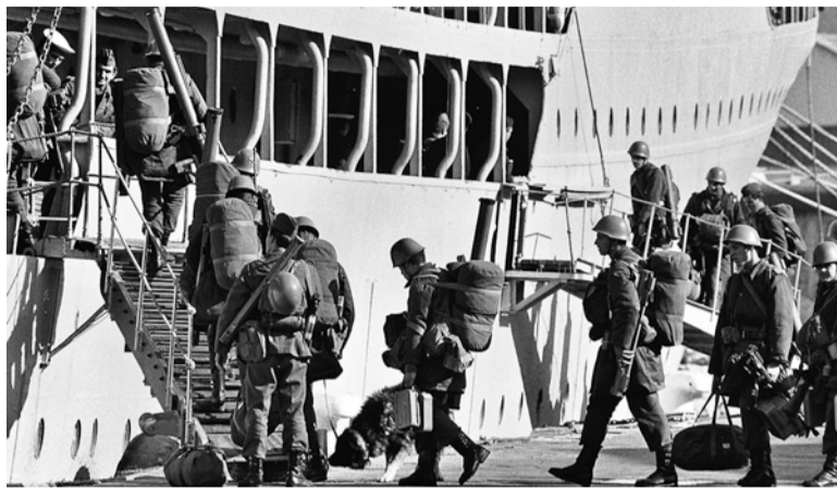
Koper, 25. oktobra 1991

Postali smo popoln gospodar na svojem strnjenem ozemlju, povezujejo nas skupni jezik, narodna zvest ter drugi zgodovinski in kulturni dejavniki. Priznala nas je mednarodna skupnost kot neodvisni su-