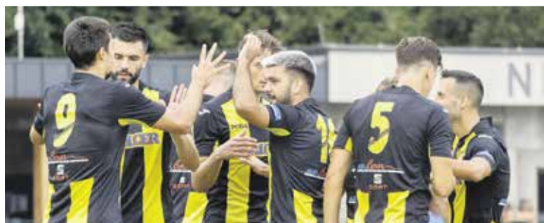
Zmaga na zmagu – trenutki, ki se jih ne naveličamo.