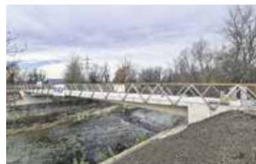
Kmalu odprtje novega mostu na Viru

V poletnih mesecih smo začeli z gradnjo novega mostu za pešce in kolesarje pri Sahari na Viru prek Kamniške Bistrice. Most v dolžini dobrih 34 metrov in širine štiri metre je zasnovan kot okvirna prednapeta ar-