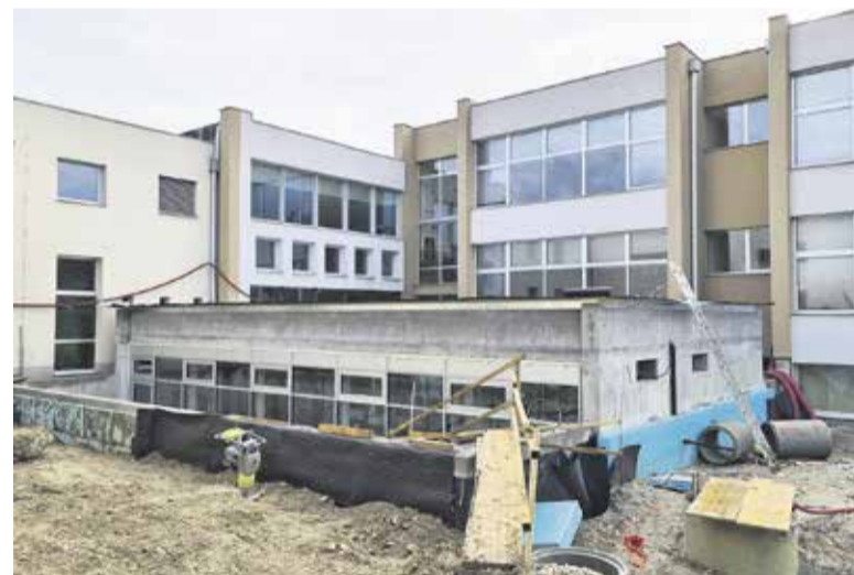
Dela na OŠ Rodica v polnem teku