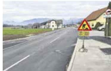
Zaključena dela na cesti Dob-Češenik-Turnše

voda in kanalizacije. Investicija bo zaključena v začetku prihodnjega leta. Občina trenutno izvaja še obnovo in izgradnjo pločnika na Linhartovi ulici v Dobu.