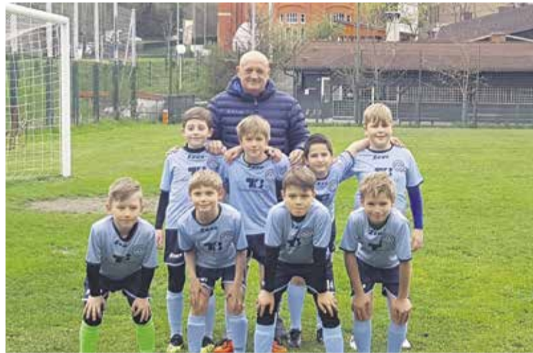
U9 na turnirju v Kamniku

pomočnik trenerja Toševskega v naši članski ekipi.