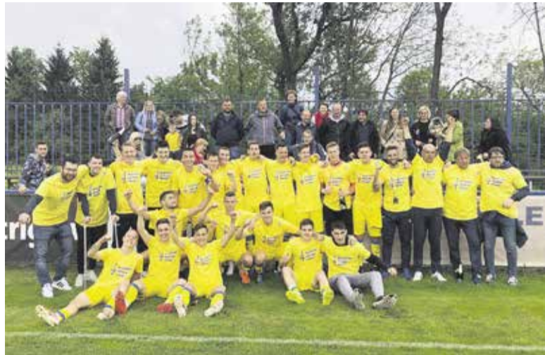
Domžalski mladinci so postali državni prvaki, skupaj s kadeti znova na vrhu.

Domžalski stroj je mlet in v maju premagal tudi Olimpijo in Maribor. Ljubljancane v Stožicah kar s 4:1. Z