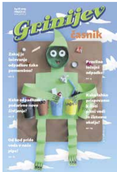
Prvi Grinijev časnik združuje najbolj zanimive prispevke otrok o ločevanju, recikliranju, varovanju okolja in vodi.

Ponosni smo, da so v natečaju sodelovali učenci vseh osnovnih šol na območju občin Domžale, Mengeš, Trzin, Lukovica in Moravče. Žirija