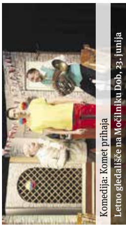
Komedija: Komet prihaja Letno gledališče na Močilniku Dob, 23. junija