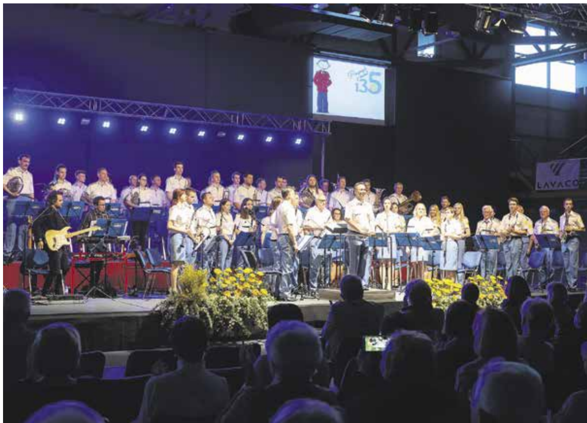
Polni dvorani obiskovalcev slavnostnega koncerta je godba postregla s pestrim glasbenim programom.

Naše praznovanje ob 135-letnici smo začeli s slavnostno akademijo, ki je bila 8. maja v Kulturnem domu Franca Bernika. Članom in članicam godbe so predstavniki Javnega sklada za kulturne dejavnosti podelili Gallusova priznanja za dolgoletno sodelovanje v kulturnem društvu. Prav tako smo mnogim članom podelili interna