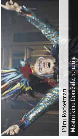
Film: Rocketman Mestni kino Domžale, 1. junija