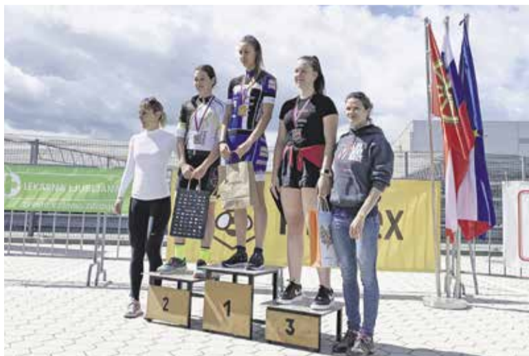
Podelitev za najboljše tri v Sprint Duatlonu v Sloveniji – kategorija mlajše mladinke

BESEDILO IN FOTO: TRIATLONSKI KLUB TRISPORT