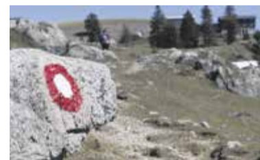
Maloplaninska želva, v ozadju Domžalski dom

popravljen, zima v gorah namreč ni nikoli prizanesljiva. Ob občinskem prazniku smo popestrili dogajanje s plezalnim stolpom, kjer smo dajali napotke in – predvsem mladino – varovali, da so lahko plezali varno. Zanimanje za plezanje je v zadnjih letih vsekakor zelo veliko.