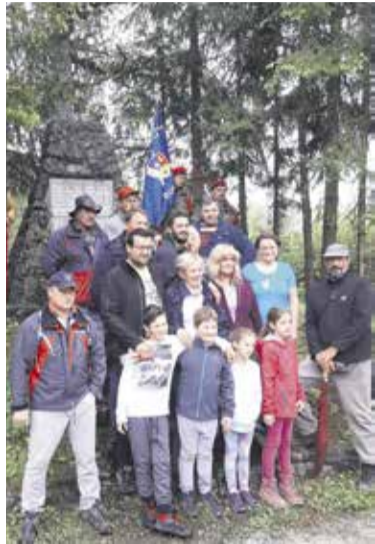
Svoji padlih in pobitih ob pomniku na Jernejevčevo domačiji. K pomniku so v spomin na mrtve in v opomin na morijo položili tudi venec.