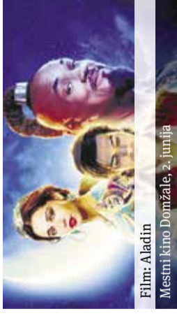
Film: Aladin Mestni kino Domžale, 2. junija