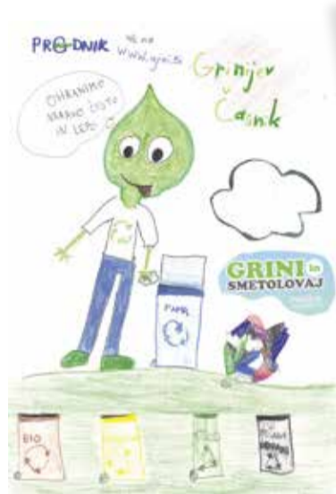
Učenci so poslali več kot 300 naslovnice, najboljše so objavljene v Grinijevem časniku. Ena izmed njih je tudi naslovnica Tie, Tjaše in Lare iz 3. i PS Ihan.