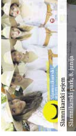
Slammikarski sejem Slammikarski park, 8. junija