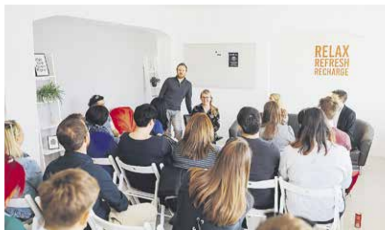
Prvi LinkedIn Local Domžale Kamnik v coworking prostorih Pisarna Tovarna