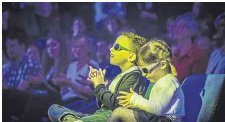
VERA VOJSKA

Z zbranimi sredstvi boste Miho in Aljo pomagali do mnogih pripomočkov, ki jih potrebujeta, da lažje sledita sovrstnikom in kljub slabovidnosti segata po zvezdah.