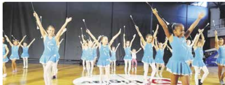
Nastop Domžalskih mažoretk na prireditvi v Grobljah nekoč in danes septembra 2018 v športni dvorani Domžale

Letos so šolsko leto zaključile malo prej, saj je njihova trenerka z majem nastopila porodniški dopust. Zaključni nastop za starše je bil v telovadnici OŠ Dragomelj v četrtek, 25. aprila