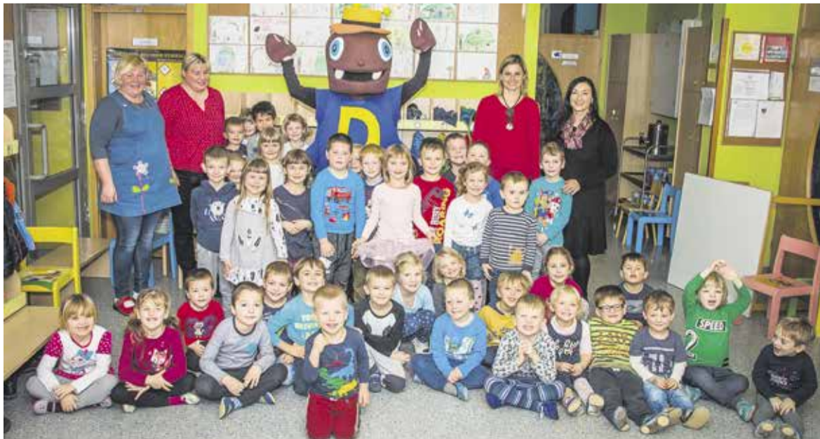
Vrtec Domžale, enota Mlinček.