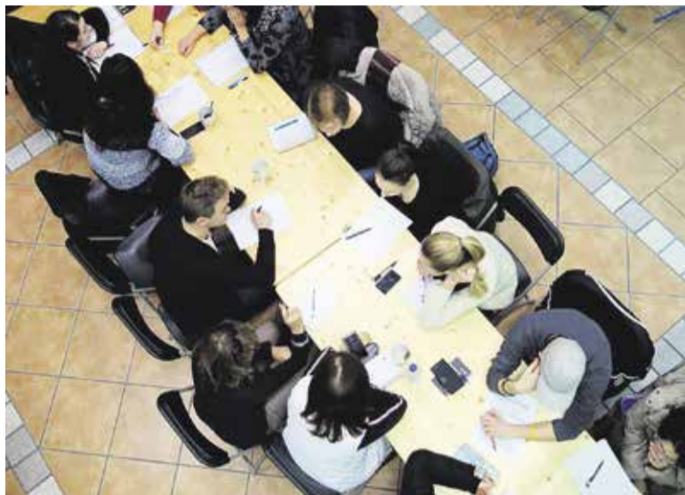
Bodoče Slamnikarske vodnice in vodniki med praktičnimi vajami v Slamnikarskem muzeju v Domžalah, januar 2018.

Če na hitro pomislimo, med katerimi turističnimi točkami občina Domžale gradi svojo prepoznavnost, sta ze-