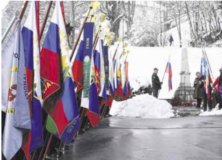
S Prešernom v nov dan

Po končani slovesnosti smo veterani vojne za Slovenijo iz domžalske-