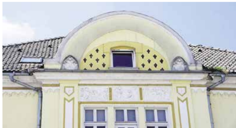
Okrasni elementi v beneškem slogu

Podjetje Gebrüder Kurzthaler je imelo več kot 3.000 m 2 zazidanih površin in več tisoč kvadratnih metrov ostalega zemljišča, vilo z vrhom, stanovanjsko hišo za delavce in celoten tehnični inventar: stroje, skladišča za blago itd. Težave za lastnika so se začele leta 1914, leta 1918 se je moral ta umakniti, ko so bila vsa 'nemška podjetja' pod nadzorom države in so vodilna mesta zavzeli Slovenci. Zaradi vse slabšega poslovanja in velikih dolgov so podjetje Ge-