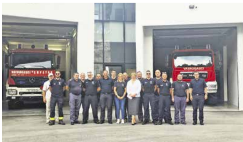
Sodelujoči v projektu rotacij Alpe Adria Knowledge Transfer – AAKT