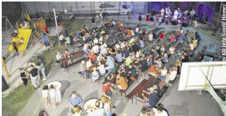
Dobrotelni koncert na Homcu je še bolj povezal krajanje.