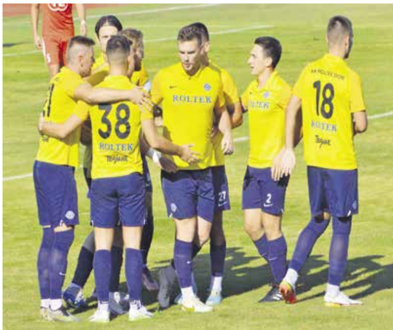
Dobljani so se na uvodnih šestih tekmah štirikrat veselili zmag.