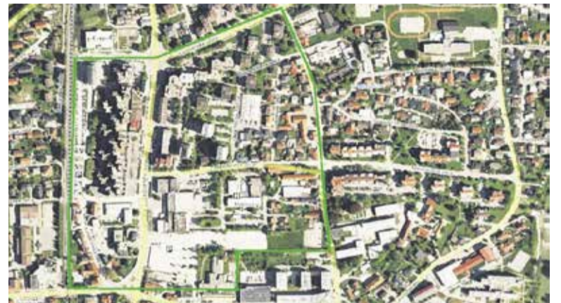
Uvedba plačljivega parkiranja znotraj označenega območja

Postopek, vsebina vloge in podrobnejša pojasnila v zvezi s pridobitvi-