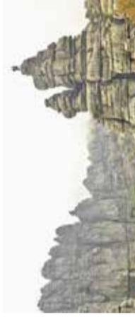
Odprtje razstave s filmskim večerom Knjžnica Domžale, 16. oktobra

Abonma filmski PONEDELJEK Drama / 2022, Iran / 159' / hitro tempirana, razburkana in nepričakovanih preobratov polna drama o družini, ki se obupano skuša otresti dušičnega bremena tradicije, patriarhata in finančne krize.