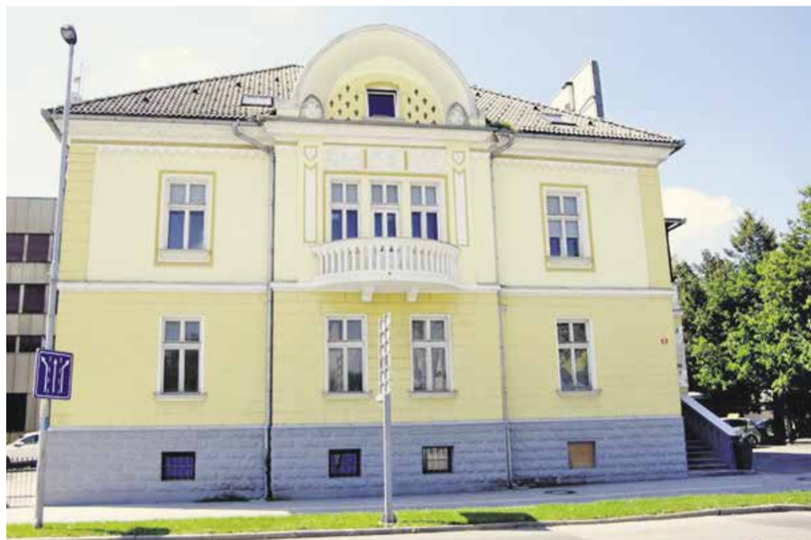
Bogato pročelje vile