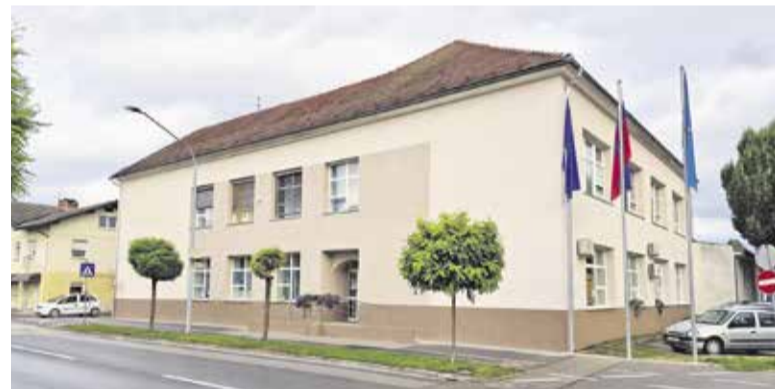
Obnovljena fasada Domžalskega doma