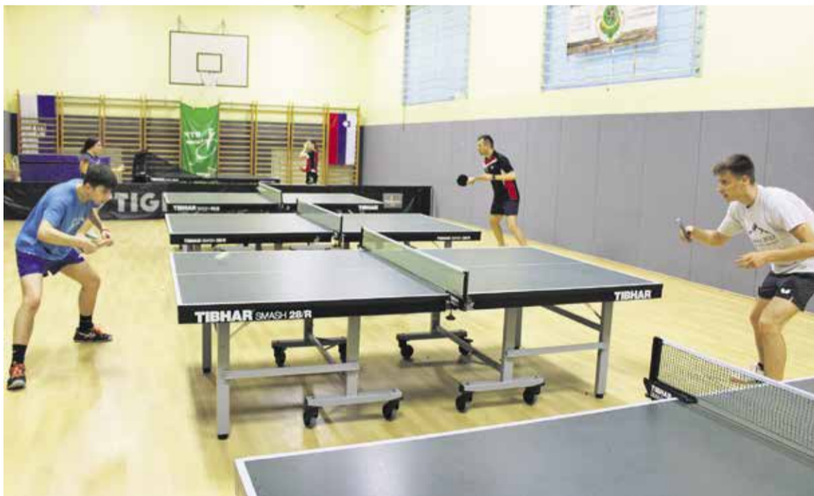
Utrinek s treninga v naši dvorani NTS Mengeš pred začetkom nove namiznoteniške sezone