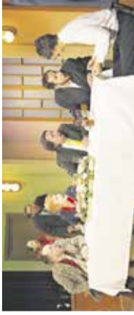
Gledališka komedija: Vraževernež Kulturni dom na Močliniku, Dob, 15. oktobra