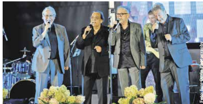
New Swing Quartet na velikem dobrotelnem koncertu Mostovi življenja

Dobrotelni koncert je uspel, saj so organizatorji zbrali 13.090 evrov, za kar so izredno hvaležni vsem obiskovalcem, ki so kupili vstopnico, in tudi donatorjem, ki so z nakazili podprli to čudovito akcijo. Zbrana sredstva bodo ob pomoči Rdečega križa Domžale, na računa katerega se steka