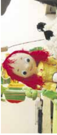
Otroška predstava: Jagoda Kulturni dom na Močliniku, Dob, 8. oktobra

19.00 | OPPENHEIMER Zgodovinska drama / režija: Christopher Nolan /