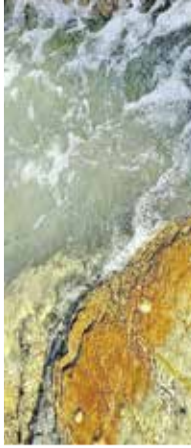
Odprije fotografske razstave Po obali Center za mlade Domžale, 19. oktobra