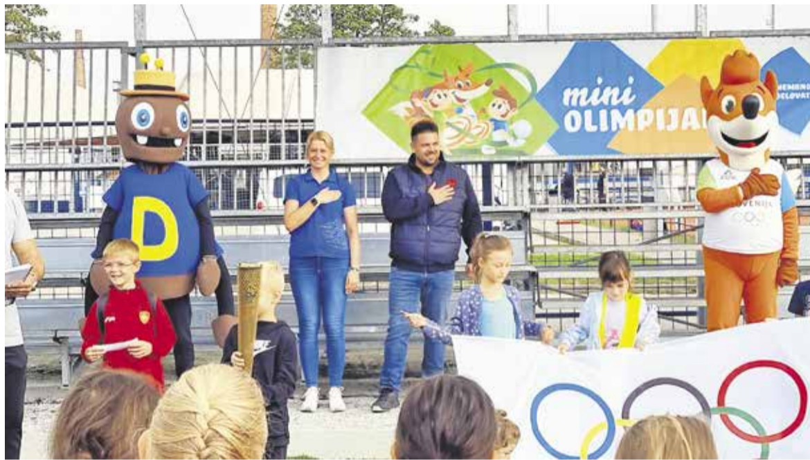
Mini olimpijada v Športnem parku Domžale

V domžalski, športni občini poteka skozi leto mnogo športnih dogodkov. V prihodnjem letu se morda obetajo tudi poslastice za kolesarske navdušence, o čemer je med drugim tekla beseda ob srečanju