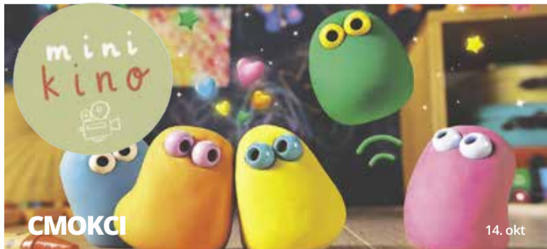
kratki animirani filmi za najmlajše / The Very Small Creatures / režija: Lucy Izzard / 2022, Velika Britanija / distribucija: Aardman / 17' / brez dialogov, 2+

Na začetku dvajsetega stoletja so pripadniki plemena Osage na svojem ozemlju odkrili nafto in čez noč postali najbogatejša ljudstva na svetu. Njihovo bogastvo je kmalu pritegnilo pozornost belih priseljencev ... Lokalni vplivnež William Hale velja za prijatelja staroselcev. Ko se iz velike vojne vrne njegov nečak Ernest, ga nagovori, naj se zbliža s premožno Mollie ... Novi film Martina Scorseseja je epška kriminalna saga o nizu umorov med pripadniki plemena Osage na začetku dvajsetega stoletja, prikazana skozi nenavadno romanco med belim prišlekom Ernestom Burkhartom in staroselko Mollie Kyle.