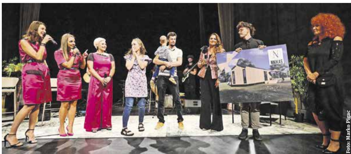
Neverjeten razplet dobrotelnega koncerta: družini podarile hišo.

Ob tej priložnosti je še omenil, da je njihova želja, da dogodek ne bo enkrat, ampak si želijo vsako jesen v Domžalah organizirati veliki dobrotelni koncert Mostovi življenja,