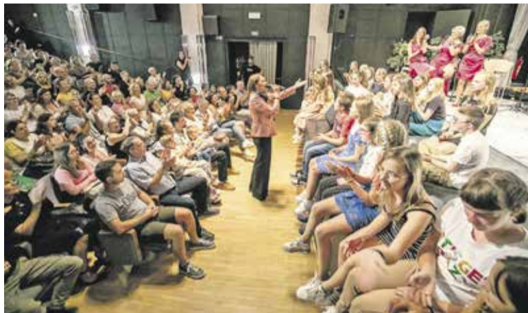
Učenci OŠ Vencija Perka in OŠ Roje so zapeli za dober namen.

O morebitni denarni pomoči s strani Občine Domžale odloča domžalski Občinski svet v četrtek, 28. septembra, ki je pristojen za razporejanje sredstev v okviru proračuna Občine Domžale za leto 2023.