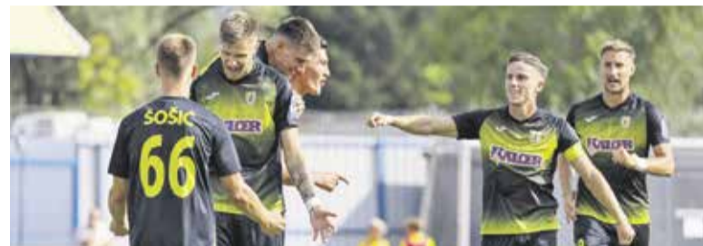
Radomljani so visoko slavili na sosedskem derbiju proti Domžalam.

ji so sredi avgusta na Fazanariji z 2:0 premagali Muro. Sledil je sicer poraz proti presenečenju prvenstva, trenutno četrtemu Bravu doma z 1:2, nato pa v septembru končno sledil niz dveh zaporednih tekem brez poraza.