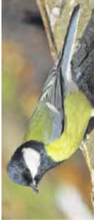
Voden ornitološki sprehod Arboretum Volčji Potok, 15. oktobra

Predstavev možganske telovadbe z metodo Brain-brain / mednarodni dan starejših / ohranjanje spomina, koncentracije in duševne vitalnosti v tretjem