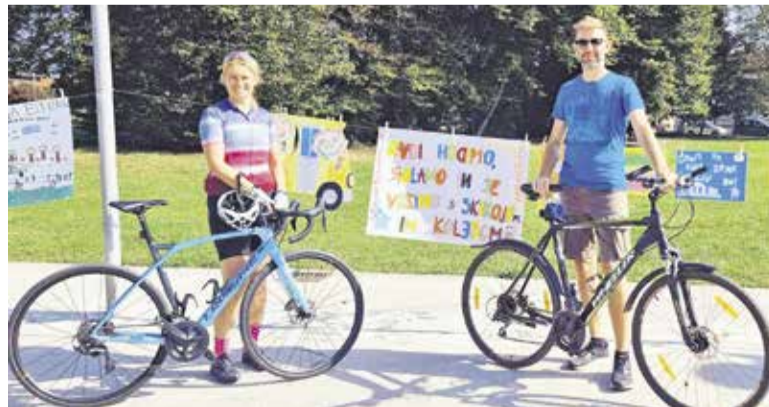
Občinska uprava je podprla prizadevanja za trajnostno mobilnost.