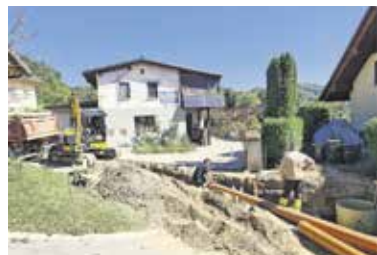
Nadaljevanje gradnje kanalizacijskega omrežja na Goričici pri Ihanu.