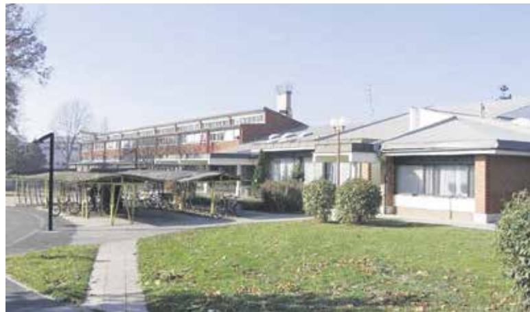
Osnovna šola Preserje danes