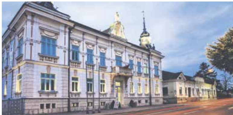
Nekdanji Društveni dom, danes je to KD Franca Bernika, je bil prizorišče prve kino-projektije, ki se je zgodila 4. oktobra 1924. Tedaj je Ludovik Železnik Domžalcem predstavil s kinematografom Malo Samaritanko. Predstav je bilo 4. in 5. oktobra še več.