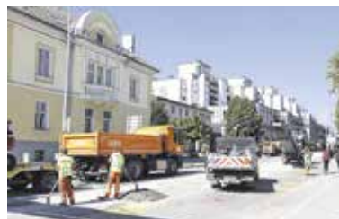
Preplastitev Ljubljanske ceste