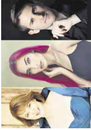
Koncert: Jesenska pesem Cerkve sv. Lenarta na Krčini, 2. oktobra