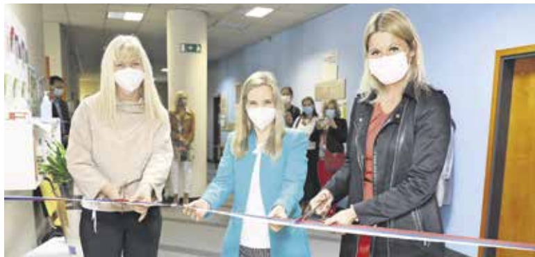
Slavnostno odprtje Centra za duševno zdravje otrok in mladostnikov Domžale

Zadnja leta je opazen trend večanja duševnih stisk otrok in mladostnikov, in pomembno je, da se na tem področju zagotovi ustrezno podporo. Obravnava v centru je multidisciplinarna in celostna, v centru pa delujejo strokovnjaki iz različnih strok: klinični psiholog, psiholog, logoped, specialni pedagog, delovni terapevt, socialni delavec in medicinska sestra.