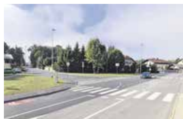
Končana prenova Igriške ulice