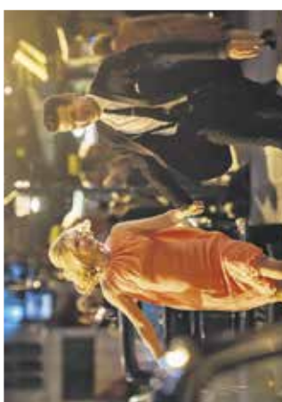
Film: Sinoči v Sohu Mestni kino Domžale, 31. oktobra