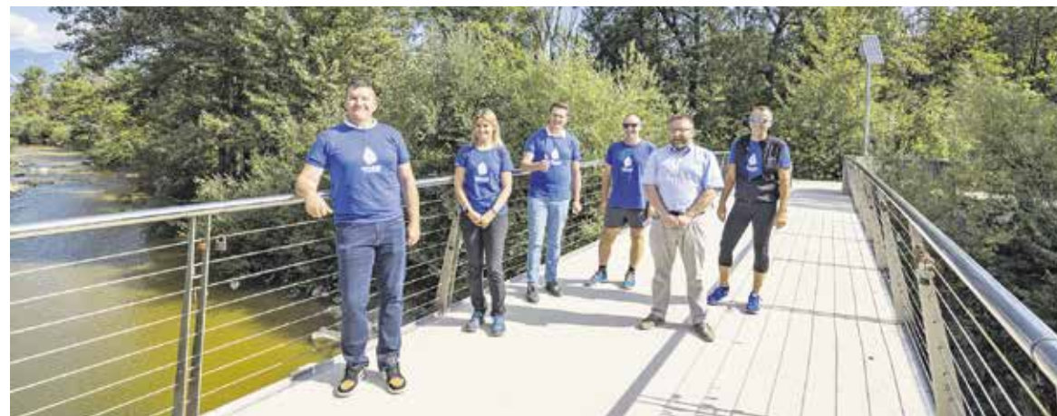
Srečanje predstavnikov obih občin in Modrih novic

tudi, kaj bosta občini obnavljali in nadgrajevali na tej pešpoti. Mogoče pa res ni več tako daleč leto, ko bo Pohod ob reki, ki povezuje, potekal od izvira do izliva Kamniške Bistrice.