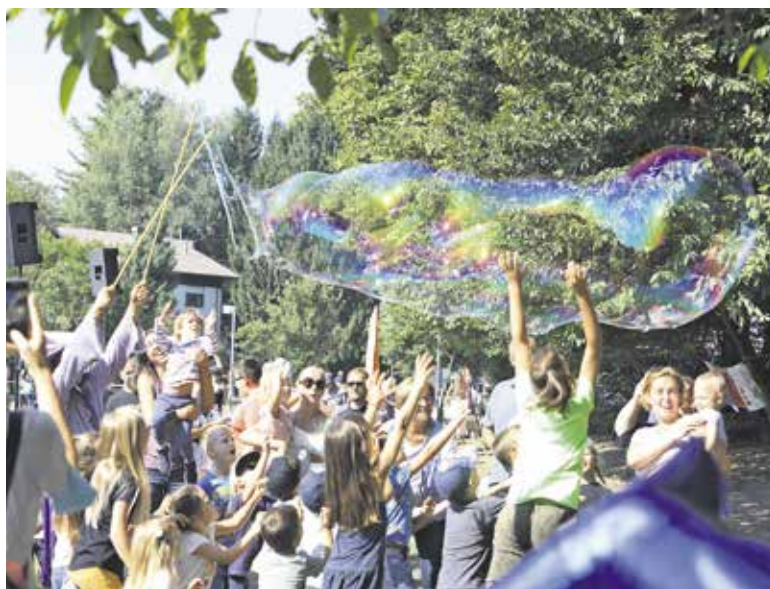
Veselje na Hroščkovem festivalu

Dogajanje v Češminovem parku se je vse do 15. ure nadaljevalo