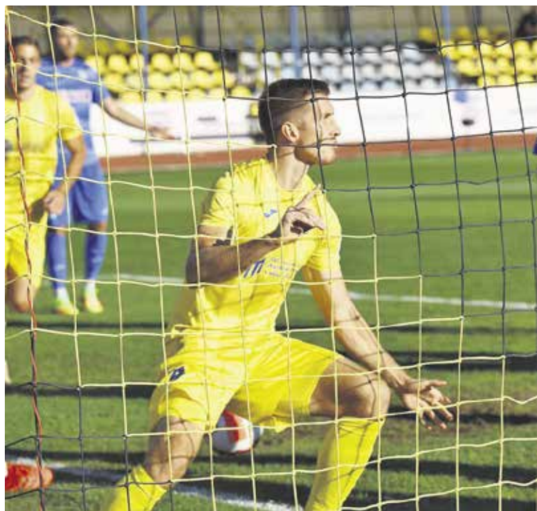
Domžalski nogometaši se ne morejo izviti iz primeža rezultatskih in igralnih nihanj.