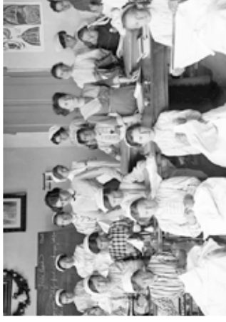
Kulturno-zgodovinsko-kulinarčna razstava Menačenkova domačija, 5. oktobra