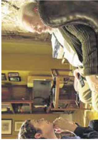
Film: Oče Mestni kino Domžale, 2. oktobra