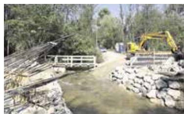
Brv za pešce in kolesarje čez Dolsko Mlinščico