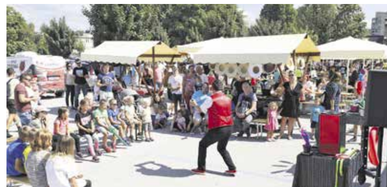
Dobro obiskana Kuhna na plac

V skrbi za okolje smo vedno pozorni tudi na to, da uporabljamo ekološko razgradljiv pribor in krožnike, za pijačo pa uporabljamo steklene kozarce. Veseli smo, da vedno dobro sodelujemo tudi s podjetjem Prodnik, ki za naš dogodek priskr-