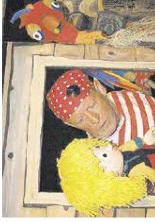
Predstava: Gusar Berto Kulturni dom na Močilniku Dob, 10. oktobra