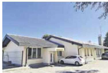
Sanacija vrtca Kekec v Radomljah je zaključena.