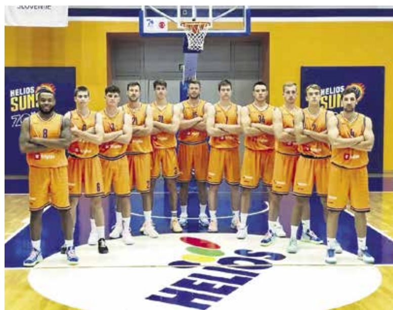
Ekipa, ki se samozavestno podaja v novo sezono.