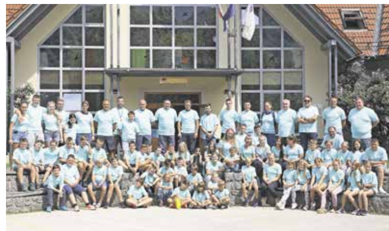
Tabor mladih gasilcev je dobro obiskan.

bili Požar in covid-19. Na koncu so prav vsi uspešno opravili malo šolo kriznega komuniciranja v Radencih ob Kolpi. Gostje so pohvalili gasilski tabor in vse sodelujoče ter poudarili pomembnost vključevanja mladih v tovrstna društva. Mentorji pa so po-