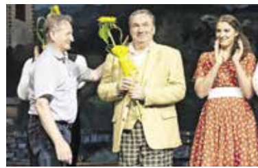
Veselje po odlični in uspešni predstavi