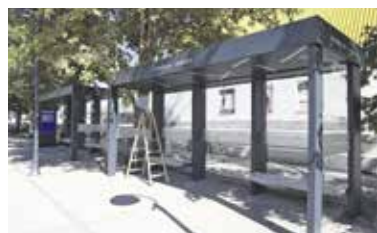
Prenovljena avtobusna postaja