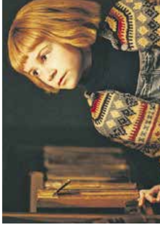
Film: Agentka za pošasti Mestni kino Domžale, 31. oktobra