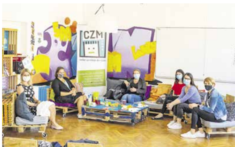
Udeleženke v prijetnem okolju Centra za mlade Domžale