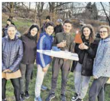
Strokovni kader 2023

Kako je lahko počitek aktiven? Z vadbo Dihamo z naravo najprej umirimo um in poglobimo dih, kar v telesu sproži umiritev živčnega sistema. Iz tega sproščenega stanja, ko so naša čustva in misli umirjene, mi pa smo povezani s svojim telesom in naravo, nadaljujemo z mehkim, enakomernim, počasnim gibanjem rok in treh delov hrbtenice: vratni, prsni in ledveni del hrbtenice. Ker se vadba izvaja v parkih, gozdčičkih in travnikih, smo vedno znova deležni tudi dobro-