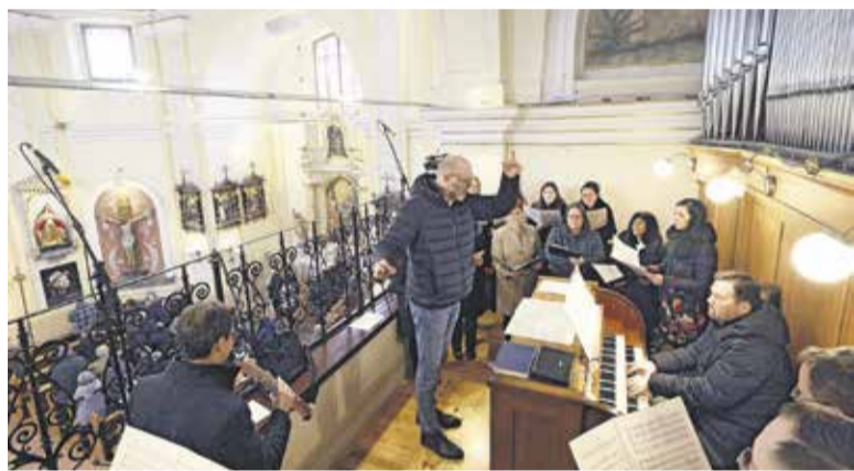
Kor na Homcu, 5.3.2023