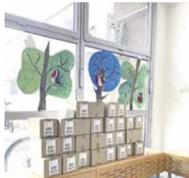
Tosamina donacija vložkov in tamponov za učence predmetne stopnje OŠ Dragomelj

tom kot fantom, razlagajo o pomenu intimnega zdravja za zdravje telega telesa. Pripravimo jim kratko, a slikovito in poučno učno uro, saj smo ugotovili, da je intima oziroma intimna nega še vedno precej kočljiva tema, o kateri šolarji ne vedo dosti ali se o njej sploh ne pogovarjajo. Poleg tega izpeljemo tudi praktično delavnico, na kateri se vsi učenci naučijo prepoznati, kakšni so dobri vložki in tamponi ter kako jih pravilno uporabljati.