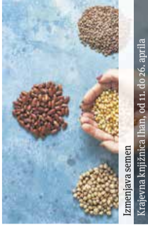
Izmenjava semen Krajevna knjižnica Ihan, od 11. do 26. aprila