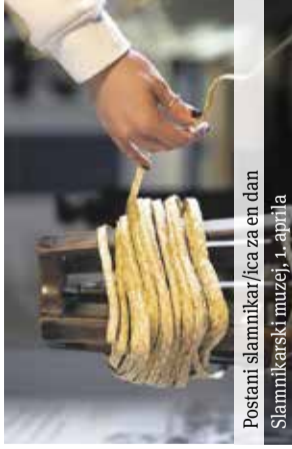
Postani slamikar/ica za en dan Slamnikarski muzej, 1. aprila