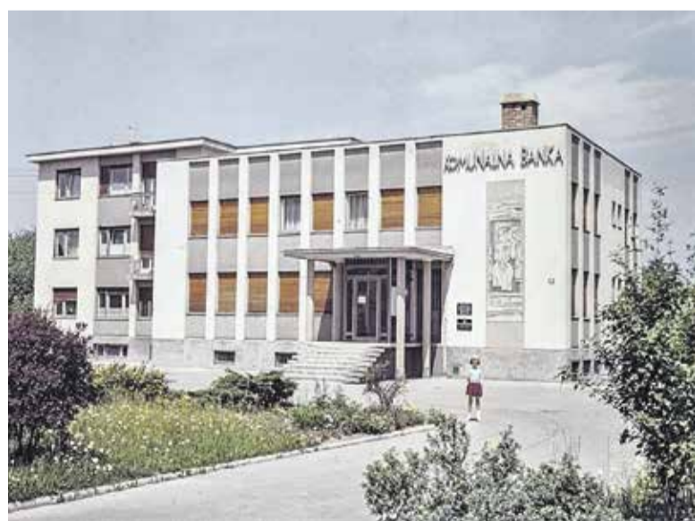
Pročelje domžalske banke z Lakovičevim fresko

Informacije in rezervacije: 041 420 610.