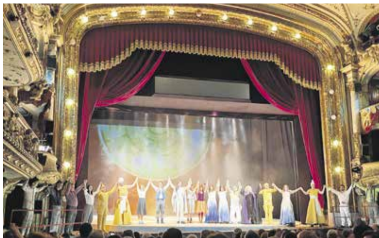
Čarobna piščal v Operi HNK v Zagrebu

Najprej je bil to homški obisk KD Jožeta Gostiča v Zagrebu. Tam je bila (4. 3.) na sporedu Mozartova opera Čarobna piščal (1791). V marsikateri od (tenorskih) vlog je v njej v daljni preteklosti nastopil tudi naš Jože Gostič (Stara Loka pri Šk. Loki, 1900–Ljubljana, 1963); ne le v Zagrebu, pač pa tudi po svetu. Kako tudi ne, saj je bil v HNK v Zagrebu kar precej sezona gost in celo stalni član, njihov prvak. Mdr. kot tak, še zlasti pa kot ljubljenec hrvaške publike je prejel tudi nagrado mesta Zagreb. Četudi v znameniti monografiji o J. Gosti-