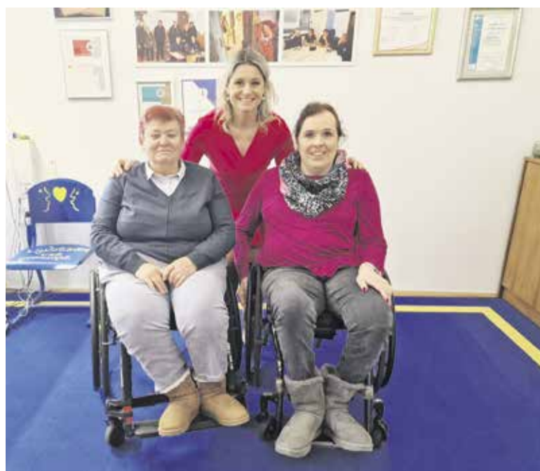
Županja je sprejela predstavnici Društva paraplegikov Ljubljanske pokrajine.