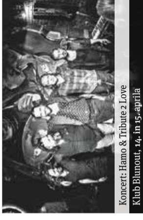
Koncert: Hamo & Tribute 2 Love Klub Blunout, 14. in 15. aprila