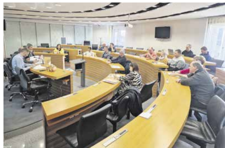
Predstavniki krajevnih skupnosti so spregovorili o nadaljnjem razvoju.