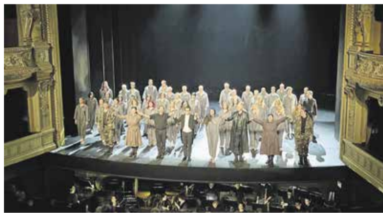
Faust v SNG Opera in balet Ljubljana