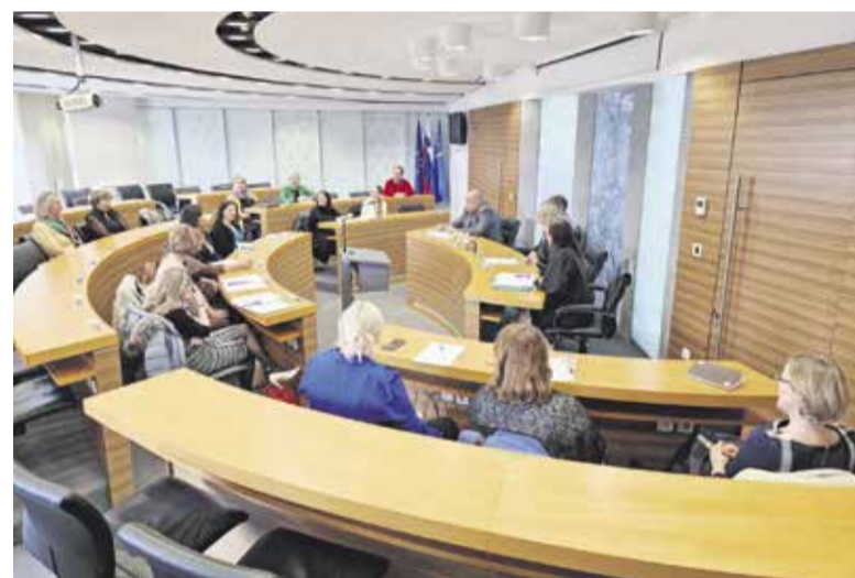
Z ravnateljci šol in vrtcev so govorili o prihodnjih investicijah.