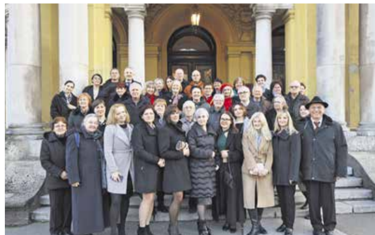
Obiskovalci opere Čarobna piščal iz Slovenije pred HNK v Zagrebu