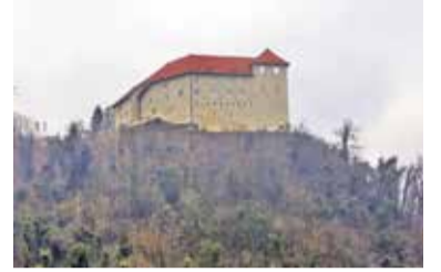
Junija načrtujemo obisk srečanja slovenskih izgnancev na gradu Rajhenburg.

Poleg ohranjanja zgodovinskega izročila bo društvo krepilo mednarodno dejavnost, informativno, publicistično in založniško dejavnost, z delom bo nadaljeval tudi informacijski center društva, ki bo nadaljeval tudi vzdrževanje in notranjo obnovo taborišča za izgon Slovencev v Brestanici.