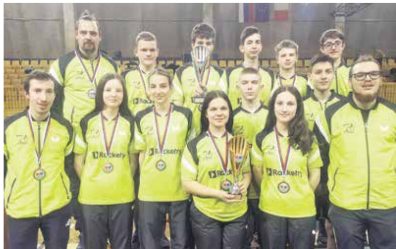
Skupinska fotografija po doseženih uspehih na ekipnem državnem prvenstvu za kadete in kadetinje v Izoli