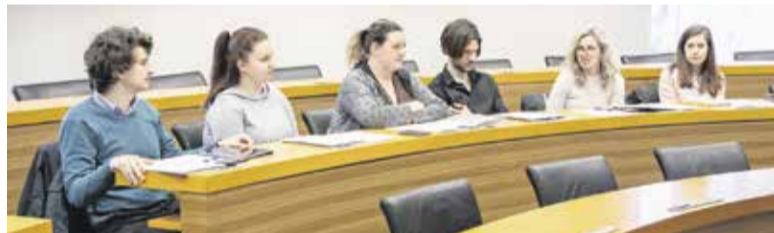
Komisija za mladinska vprašanja mora doreči kriterije za javni razpis za delo z mladimi.