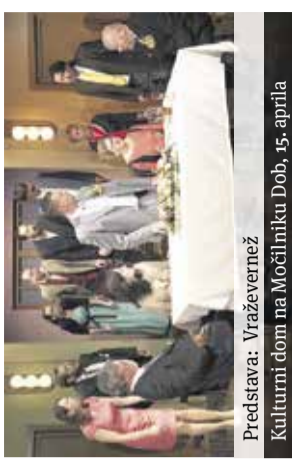
Predstava: Vraževernež Kulturni dom na Močilniku Dob, 15. aprila