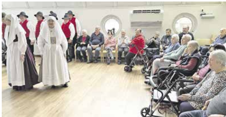
Nastop Folklornega društva Groblje

Nato so se že začele priprave na mednarodni dan žensk in dan mučenikov. Na ustvarjalnih delavnicah so stanovalci poskrbeli, da je bil dom praznikoma primerno okrašen, 8. marca pa so stanovalke in zaposlene obdarili z vrtnicami. Na popoldanskem druženju so nastopili člani Folklornega društva Groblje, katerih ples ni nikogar pustil ravnodušnega. Stanovalcem so predstavili različne ljudske plese, od gorenjskih, koroških in dolenskih do prekmurskih. Vzdušje je bilo prešerno, zvoki melodij in petja pa so pobožali sleherno dušo.