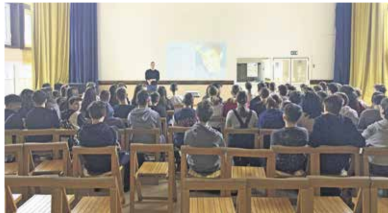
Učenci šestih razredov OŠ Domžale na predavanju o intimni negi

Seveda – najpomembnejši. Odločitev za donacijo smo namreč sprejeli tudi v skladu s poslanstvom podjetja, ki nam narekuje, da o zdravi in pravilni uporabi higienskih izdelkov osvješčamo in izobražujemo uporabnice, predvsem mlada dekleta. Dobro namreč razumemo vrednote žensk, zato pri izdelavi higienskih izdelkov v ospredje brezkompromisno postavljamo njihovo zdravje. Vsi vložki in tamponi, ki jih šole prejmejo, so narejeni iz najbolj naravnih materialov, v izobraževalnem delu projekta pa naši strokovnjaki učencem, tako deklet-