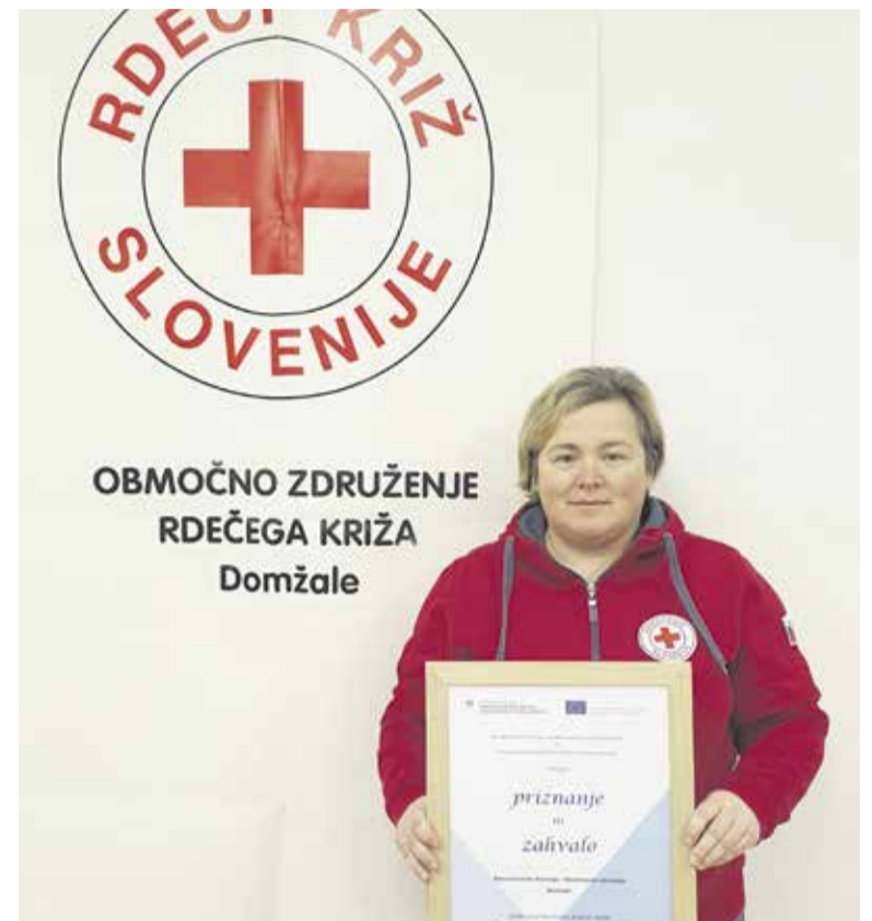
Ministrstvo za delo, družino, socialne zadeve in enake možnosti je v februarju 2023 Območnemu združenju RK Domžale podelilo priznanje in zahvalo za dolgoletno razdeljevanje hrane iz sklada za evropsko pomoč najbolj ogroženim. Čestitke in iskrena hvala vsem prostovoljcem.

trov olja, 4599 kg moke, 2973 kg riža, 4979 kosov pločevink fižola, 3216 kosov pločevink pelatov, 2288 kg špagetov, 2268 kg polžkov, 4272 kosov pločevink graha, 905 kosov marmelade; razdeljeni je bilo 918 kartonov prehranskih paketov Tuš (FIHO, la-