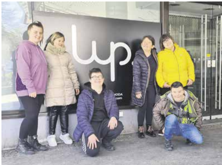
Trgovina Lup je novo delovno okolje za mladostnike s posebnimi potrebami iz dnevnega centra domžalskega društva Verjamem vate.

Trgovina Lup ima še širši pomen, saj bo širše povezovala ljudi, ozaveščala o sprejemanju drugačnosti in pomenu ponovne uporabe za pla-