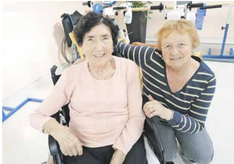
Gospa Danica je bila obiska zelo vesela.

O tem, da starejše člane in članice obiščejo doma, imajo v svojih programih tako društva upokojencev, krajevne organizacije borcev za vrednote NOB, tudi poverjeniki Rdečega križa radi potrkaajo na vrata starejših, obiskov so deležni tudi bolni, pa še kdo. V Krajevni skupnosti Dob, ki je zelo poznana po dobri organiziranosti na vseh področjih, najbrž enako velja tudi za druge krajevne skupnosti, bi našli še vrsto drugih društev in organizacij, ki nikoli ne pozabijo na prijetna srečanja ter voščila. Nenazadnje je prav Svet KS Dob tisti, ki vsako leto na prijetno srečanje povabi krajanke in krajanke, starejše od 70 let, in ti se tovrstnih srečanj zelo radi udeležujejo.