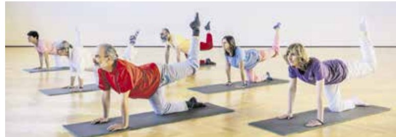
Utrinek z vadbe (mardžari – mačka)

vadbo koncentracije. Učimo se umiriti misli in čustva, kar je spet eden od načinov premagovanja stresa in učenja sprostitve. Dandanes smo veliko preveč obremenjeni z vsemi mogočimi vtisi in težko ločimo, kaj je pomembno in vredno naše pozornosti, kaj pa je samo balast, ki nas brez potrebe obremenjuje. Učitelji se pritožujejo, da se otroci ne zna-