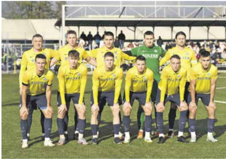
Jesenski prvaki, ki si želijo ostali vodilni vse do konca sezone.