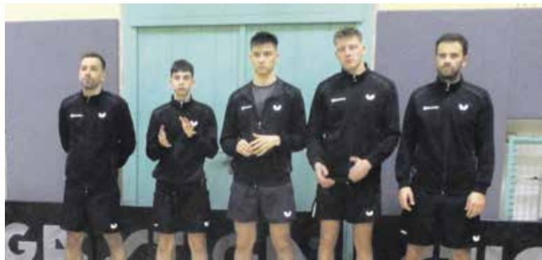
Pomlajena ekipa NTS Mengeš uspešno nastopa v elitni, 1. slovenski namiznoteniški ligi, kjer trenutno zaseda šesto mesto.