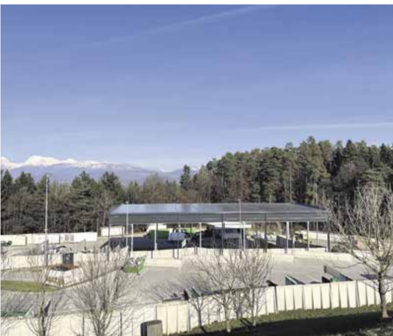
Nov pokrit objekt na Centru za ravnanje z odpadki Dob