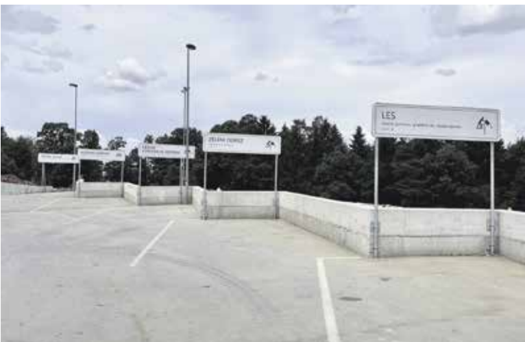
Zbirni center za uporabnike komunalnih storitev